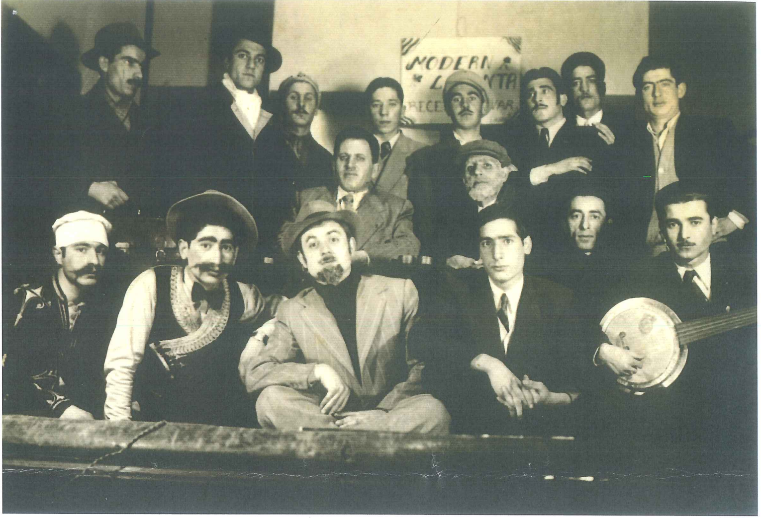
"Modern Lokanta" piyesinden sonra. Yıl 1948. (Önde oturanlardan soldan ikinci)