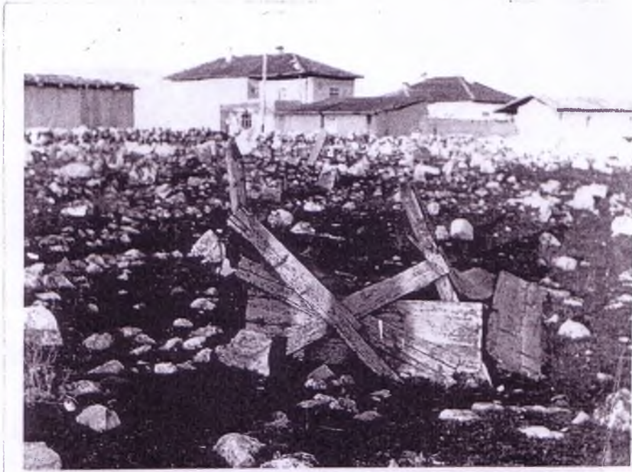
Oyaca'da eski bir mezar şekli