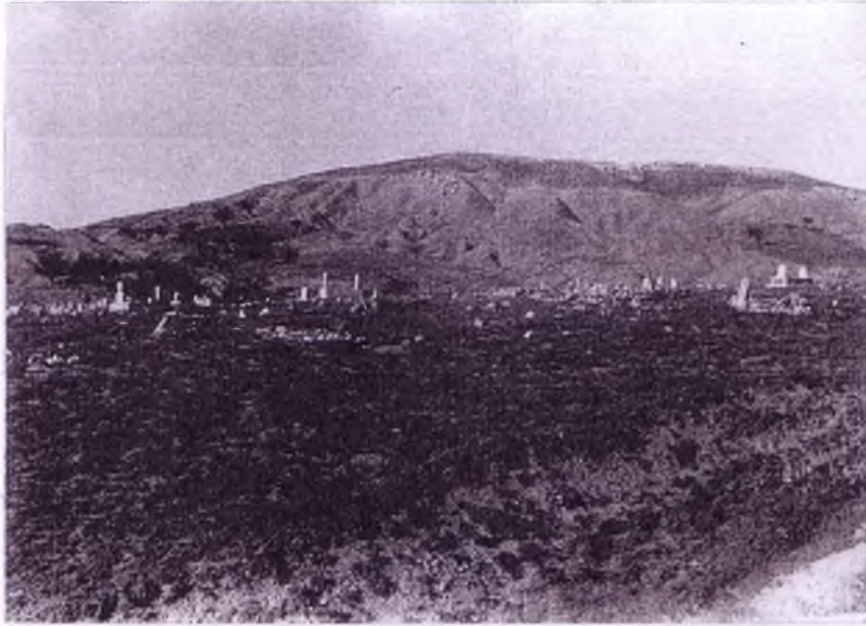
Haymana içinde,eski mezarlığın uzaktan görünüşü