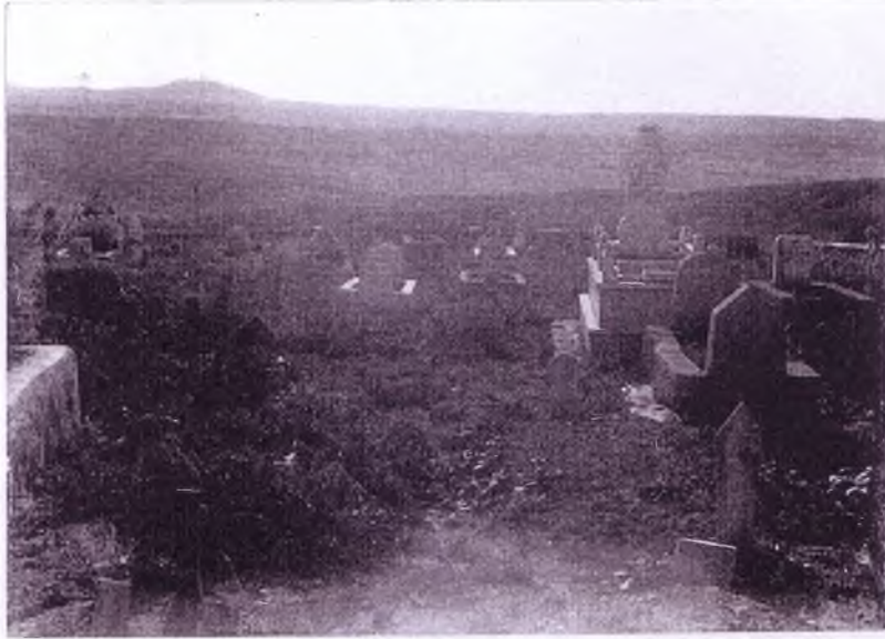
Haymana içinde, mezarlığın uzaktan görünüşü