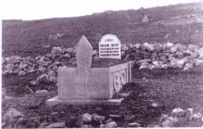
Topaklı Köyünde bir mezar şekli