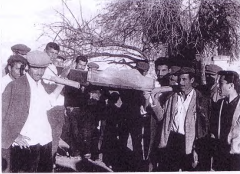
Dereköy'de ölüyü taşıdıkları tabut