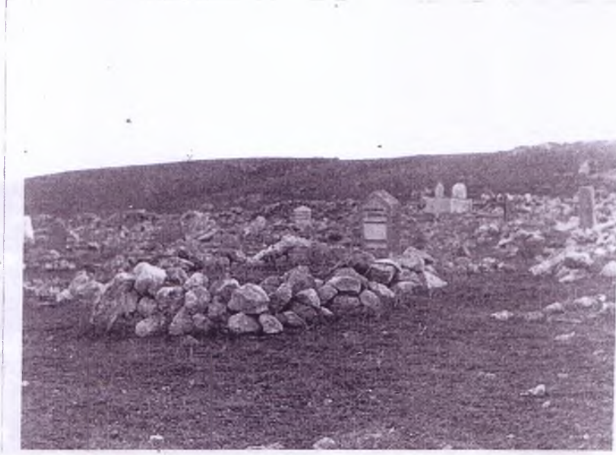
Dereköy'den mezarlığın genel görünüü