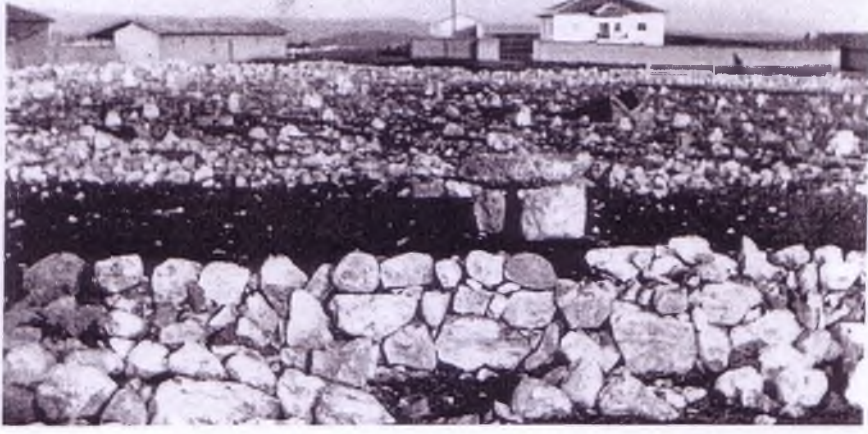
Oyaca köyünde mezarlığın uzaktan görünüşü