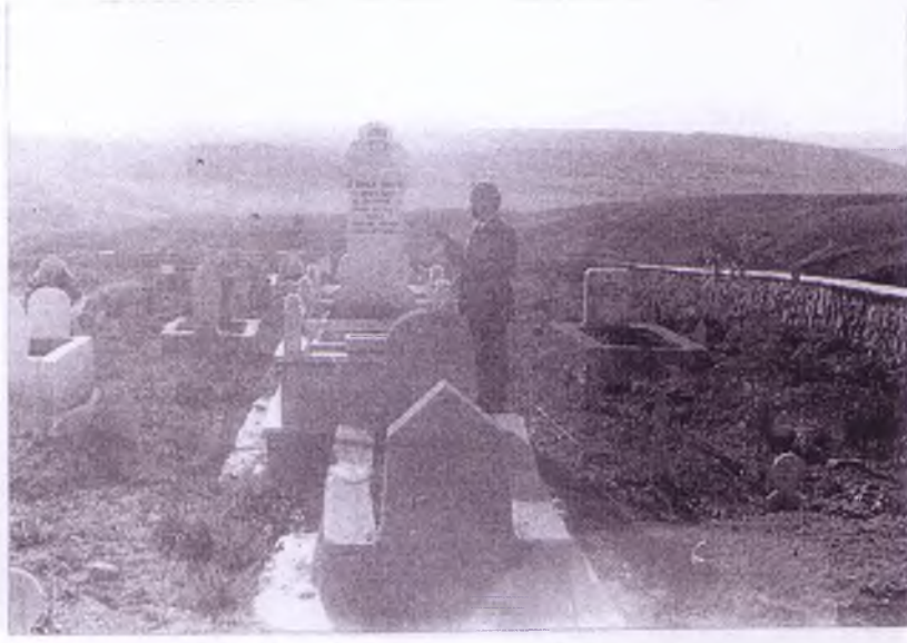
Haymana içindeki mezarlıkta bir ziyaretçi