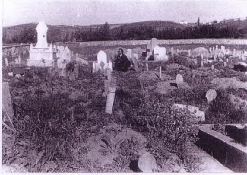
Haymana içinde, mezarlığın uzaktan görünüşü