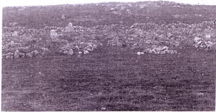
Gedik Köyünden mezarlığın genel görünüşü