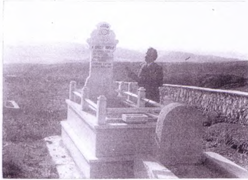
Haymana içindeki yeni mezarlıkta dua eden bir ziyaretçi