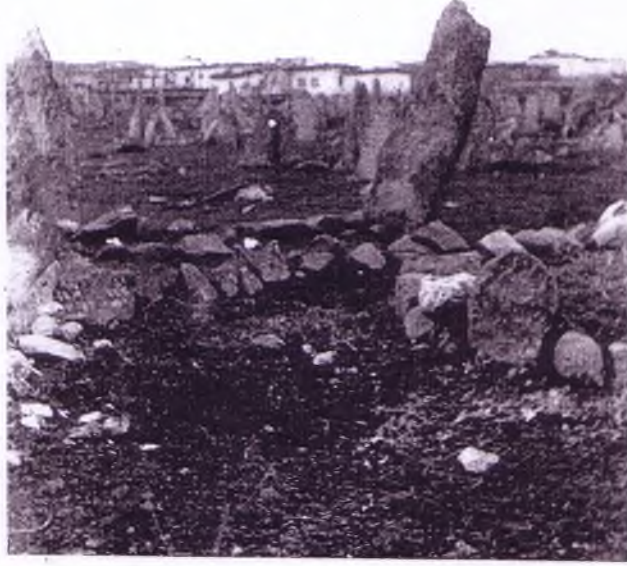
Yeniköy'de mezarlığın görünüşü