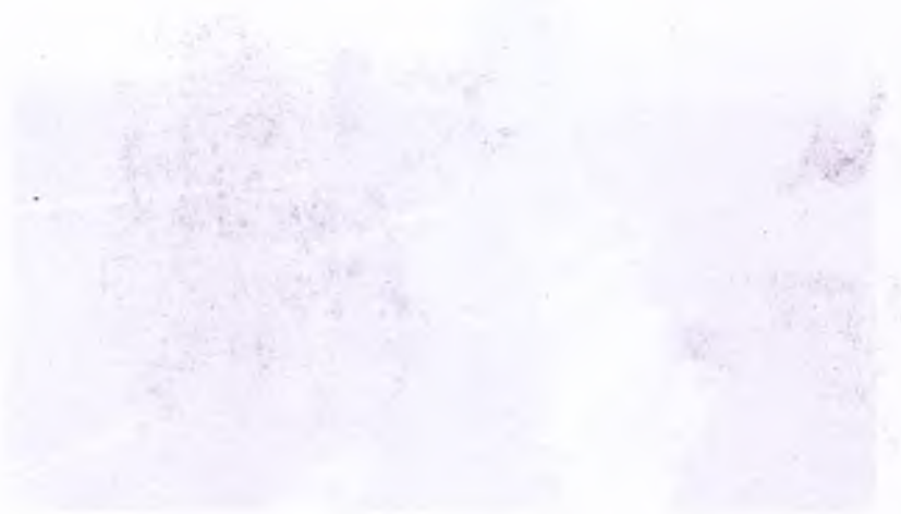
Dereköy'de ölüyü taşıdıkları tabut