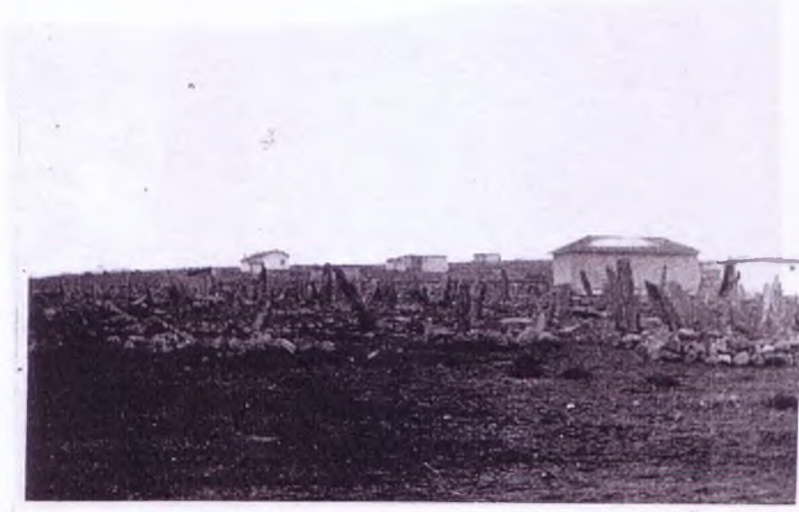
Yeniköy'de mezarlığın görünüŧü