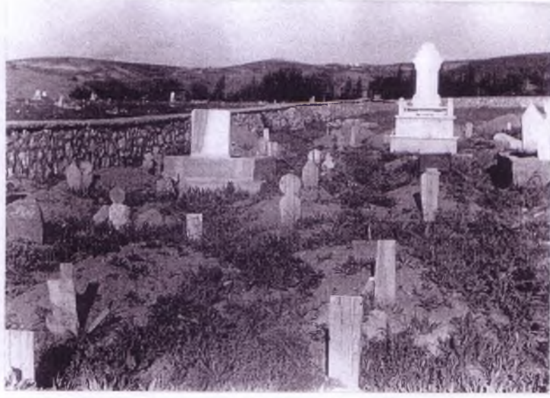
Haymana içindeki yeni mezarlığın bir kısmının görünüşü