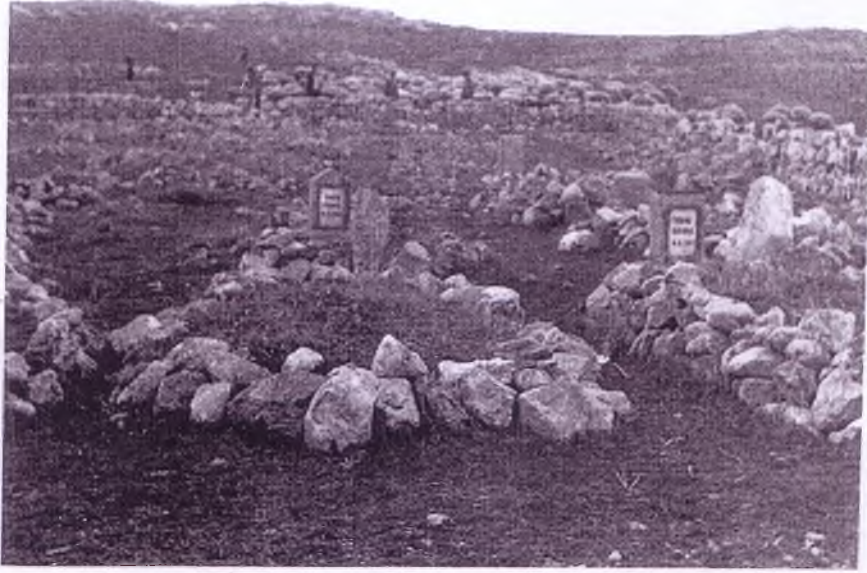
Dereköy'de mezarlığın uzaktan görünüşü