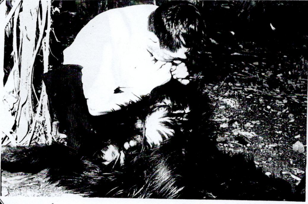
Resim 9- Kurbanın ŐŐirilmesi.