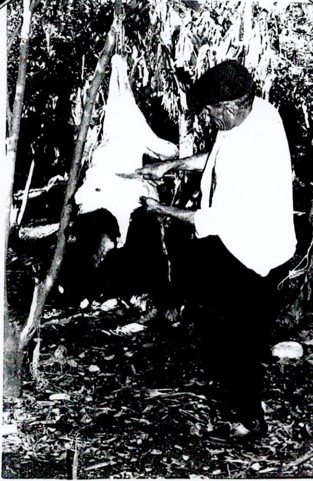
Resim 13- Derisinin yüzülmesi.