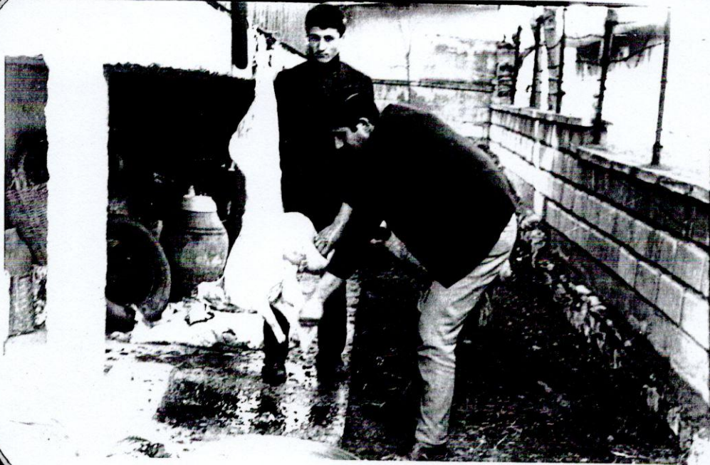
Resim 14- Kurbanın iç organlarının çıkarılması.