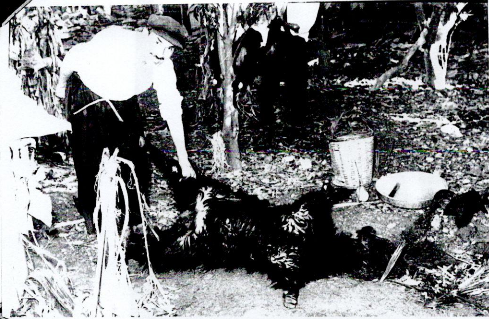
Resim 10- ŐŐirilmiŐ ve grlmeye hazır bir kurban.