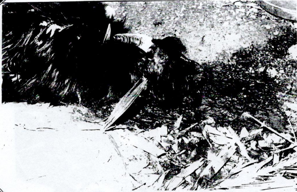
Resim 2- Kesilmeye hazır bir keçi.