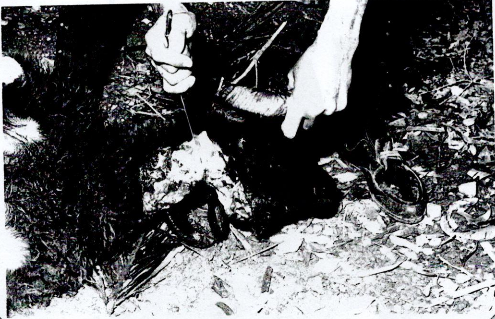
Resim 6- Kurbanın başının gövdeden ayrılması.