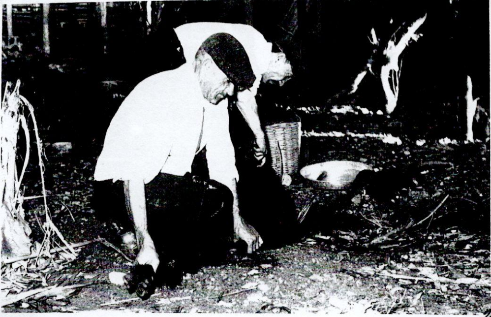
Resim 5- Kurban kesilirken