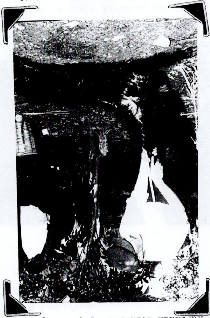
Resim 7- Kurbanın derisinin sırtına hazırlanması.