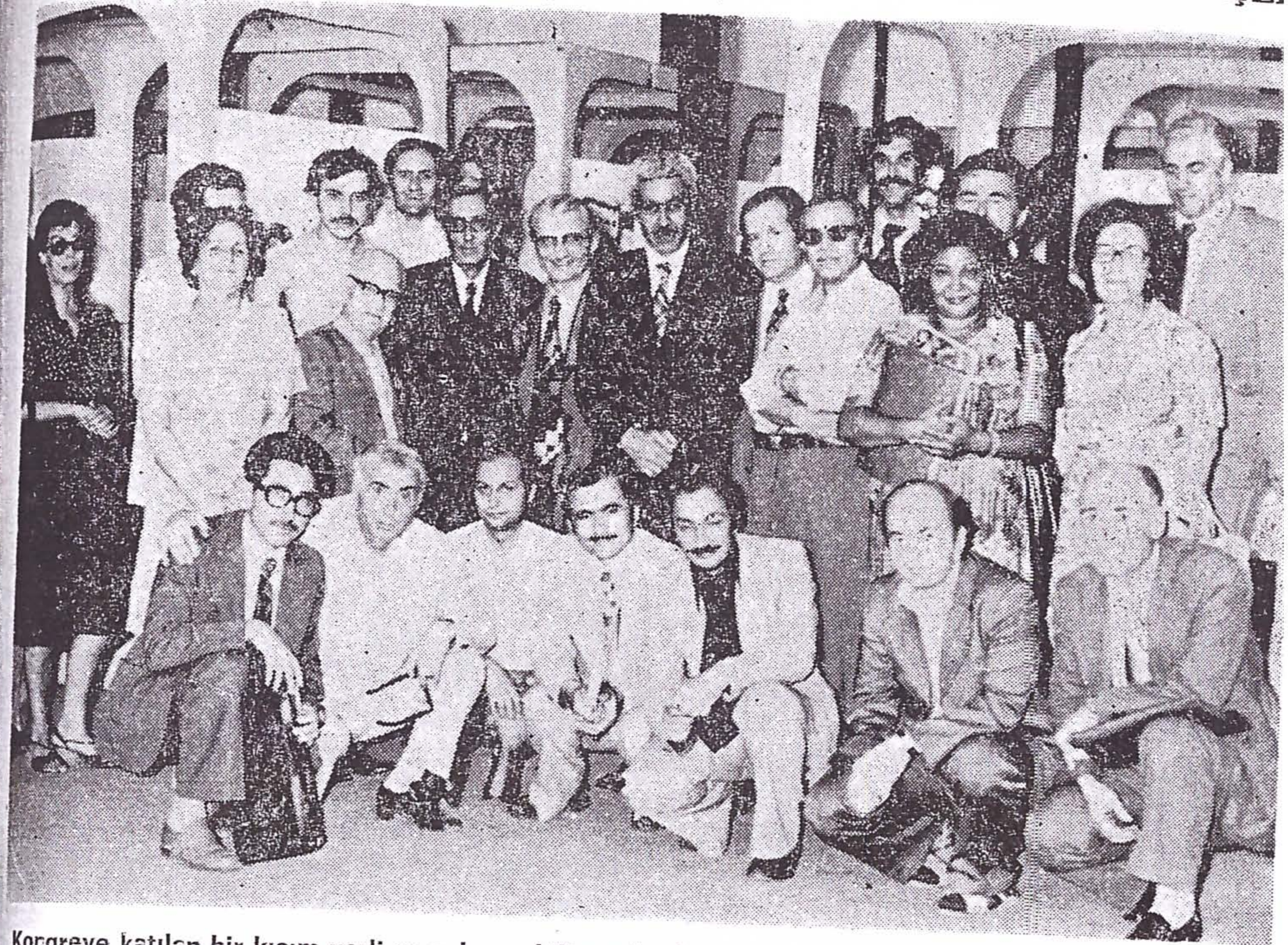
Kongreye katılan bir kısım yerli ve yabancı bilim adamları Fotoğraflarla Halk Yaşantısı sergisi önünde